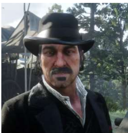
Dutch van der Linde en 1899

Un casse à la Banque Coopérative, perpétré par une bande de hors-la-loi sans scrupules (comme tous les hors-la-loi) menée par un certain Dutch van der Linde (cliché ci-dessous), avait mal tourné pour eux car les voleurs, qui étaient repartis sur un Ferry de la Compagnie maritime Lemoyne Eastern Riverboat avec 150 000$ en or, avaient tout perdu vu que le bateau avait coulé, détruit par les tirs des Forces de Police qui voulaient les empêcher de fuir 1 .