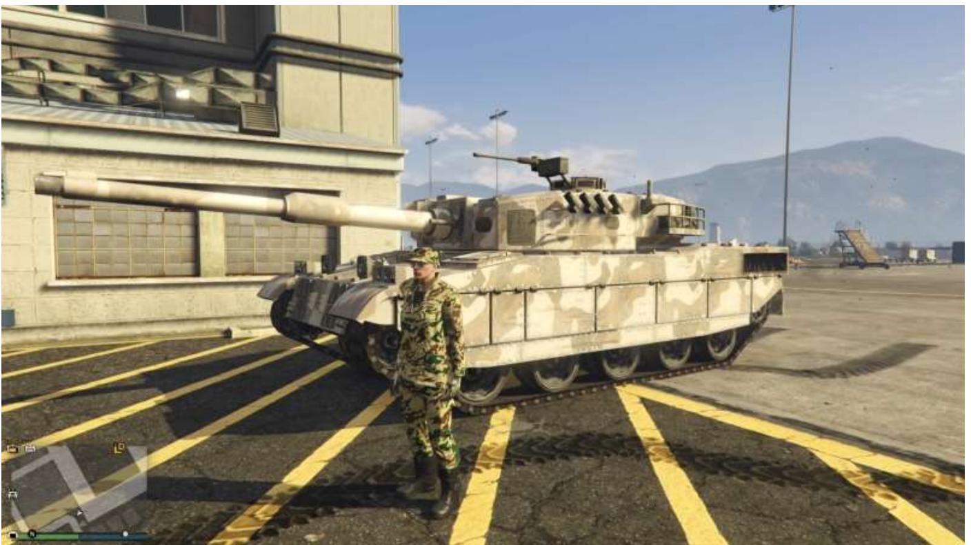
Un Rhino féroce en stationnement (provisoire) sur la Base 0101 de Fort Zancudo