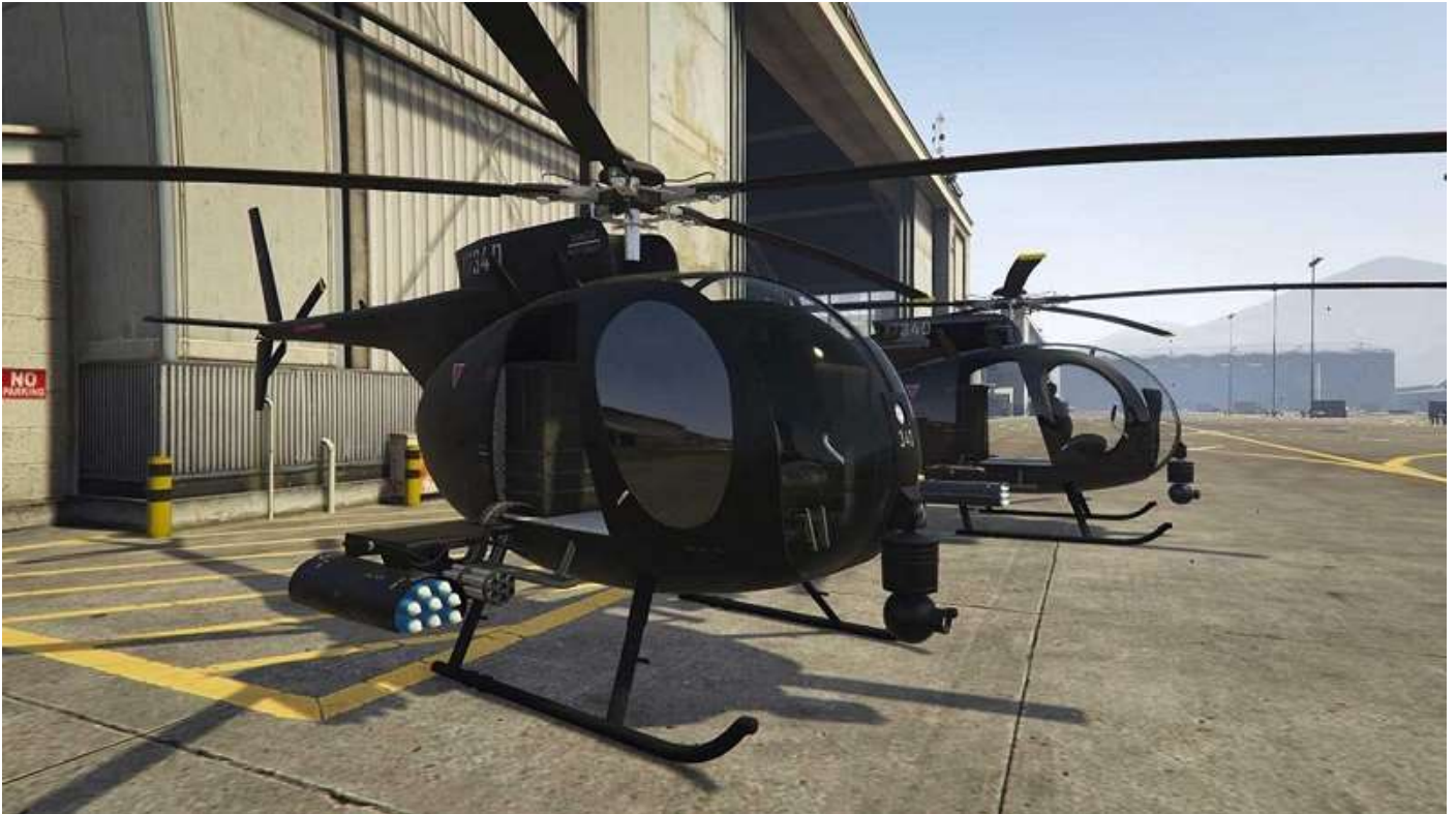
Deux Buzzards d'attaque