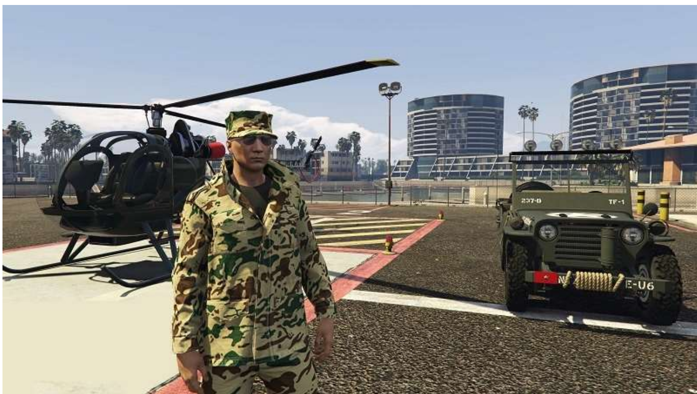
Un Jack Sparrow « Pirate » à gauche, le reste sans changement.