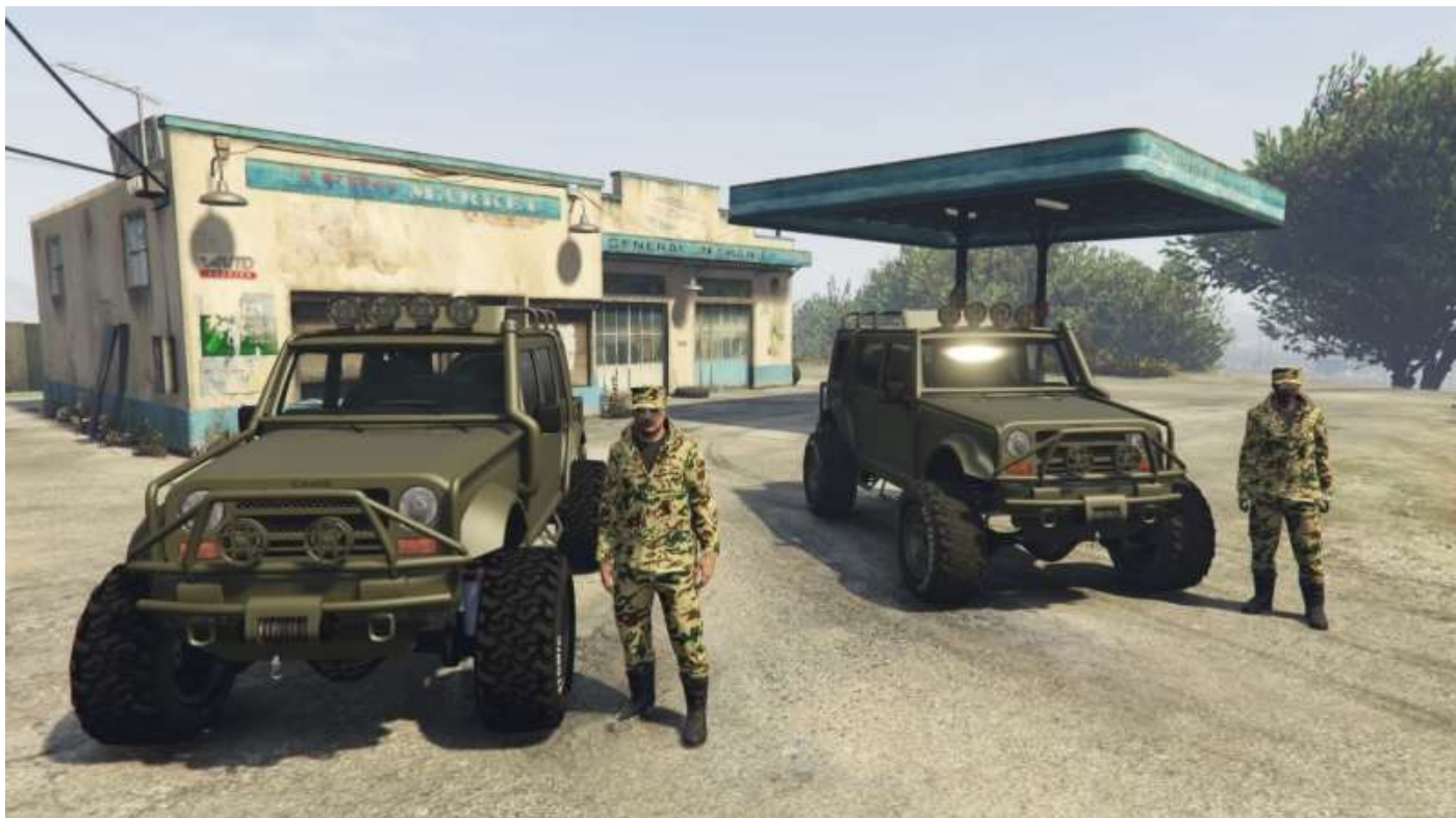
Deux Mesa, mais ça c'est pour les liaisons non dangereuses.