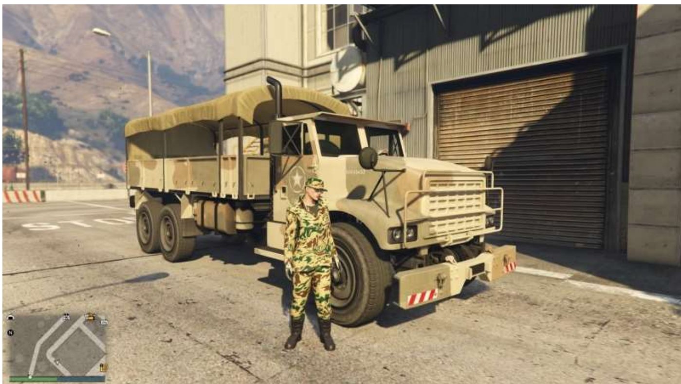
Un Barracks « Obama » devant un hangar à Barracks sur la Base 0101 de Fort Zancudo