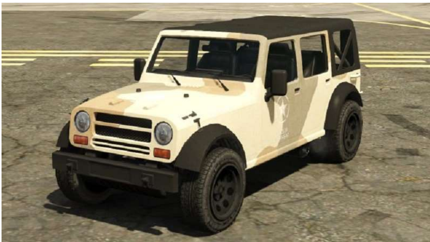
Canis Crusader pour transporter les chiens de combat sur zone