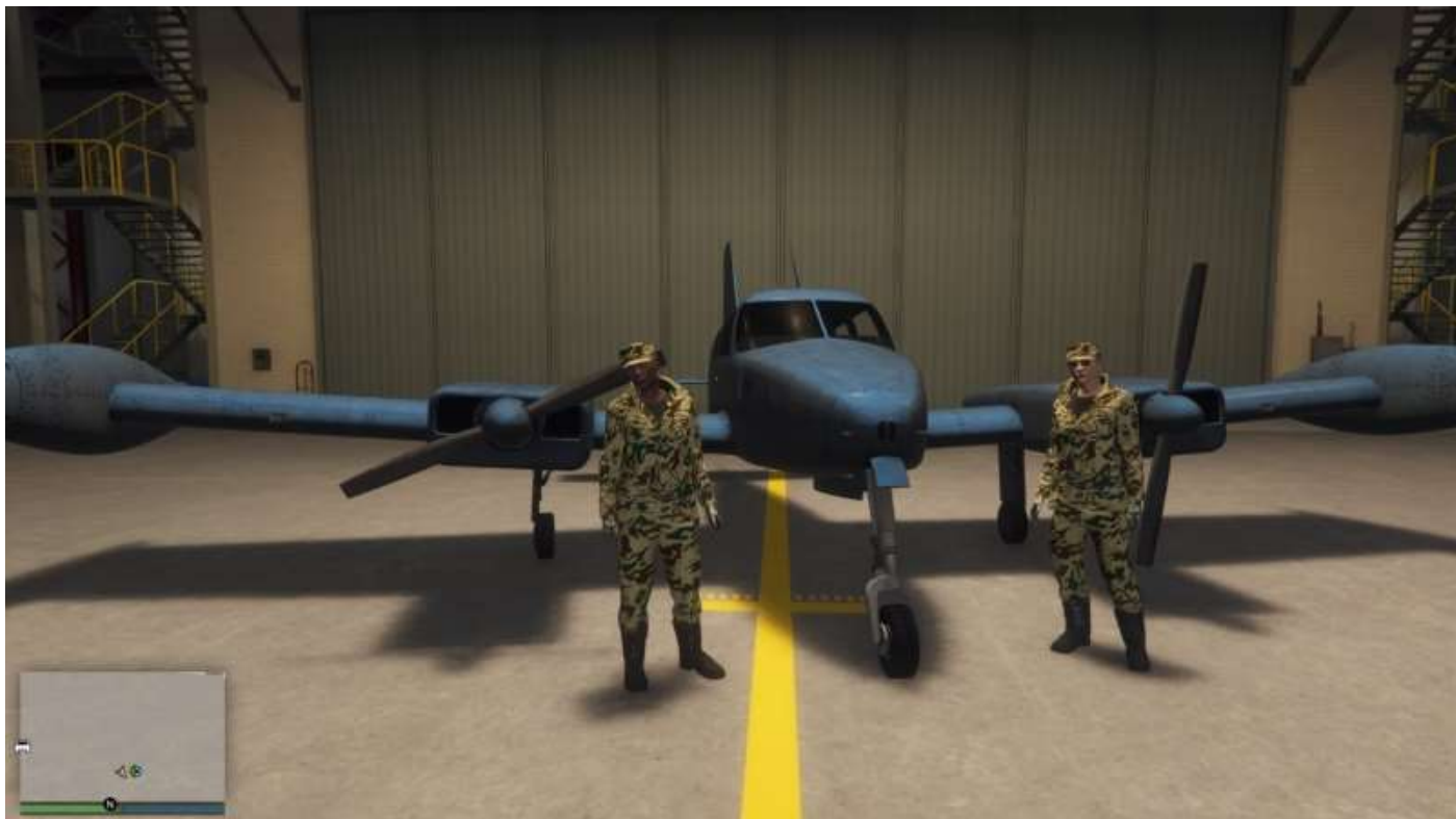
Cuban 800 de liaison non dangereuse avant mise en peinture réglementaire.