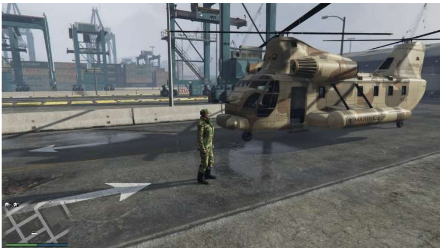
Un CargoBob, Bob.