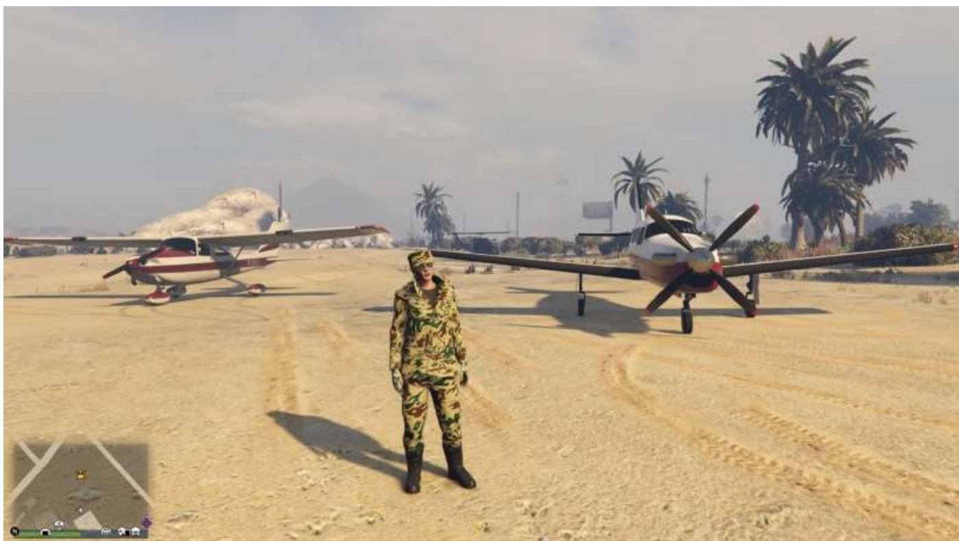
Un Mammatus (à gauche) et un Velum (à droite) à l'aérodrome de Sandy Shores