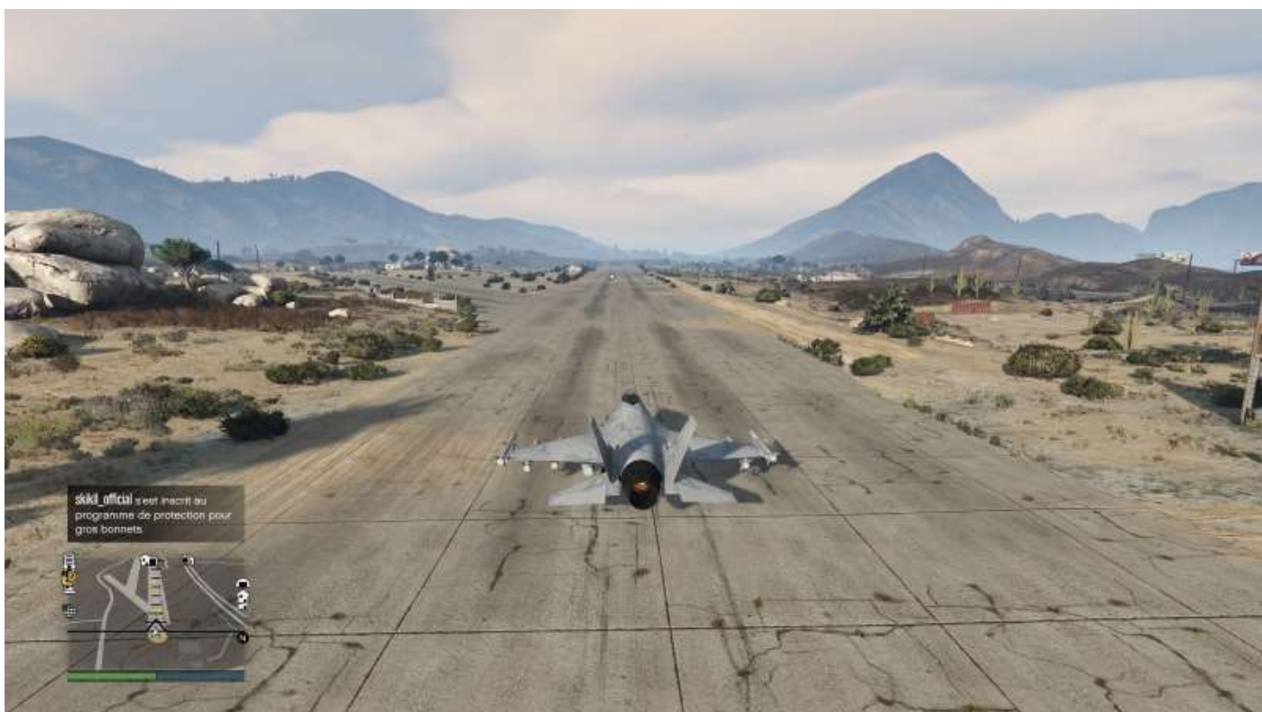
P-996 Lazer au décollage depuis la piste de l'aérodrome de Sandy Shores avant patch de l'image