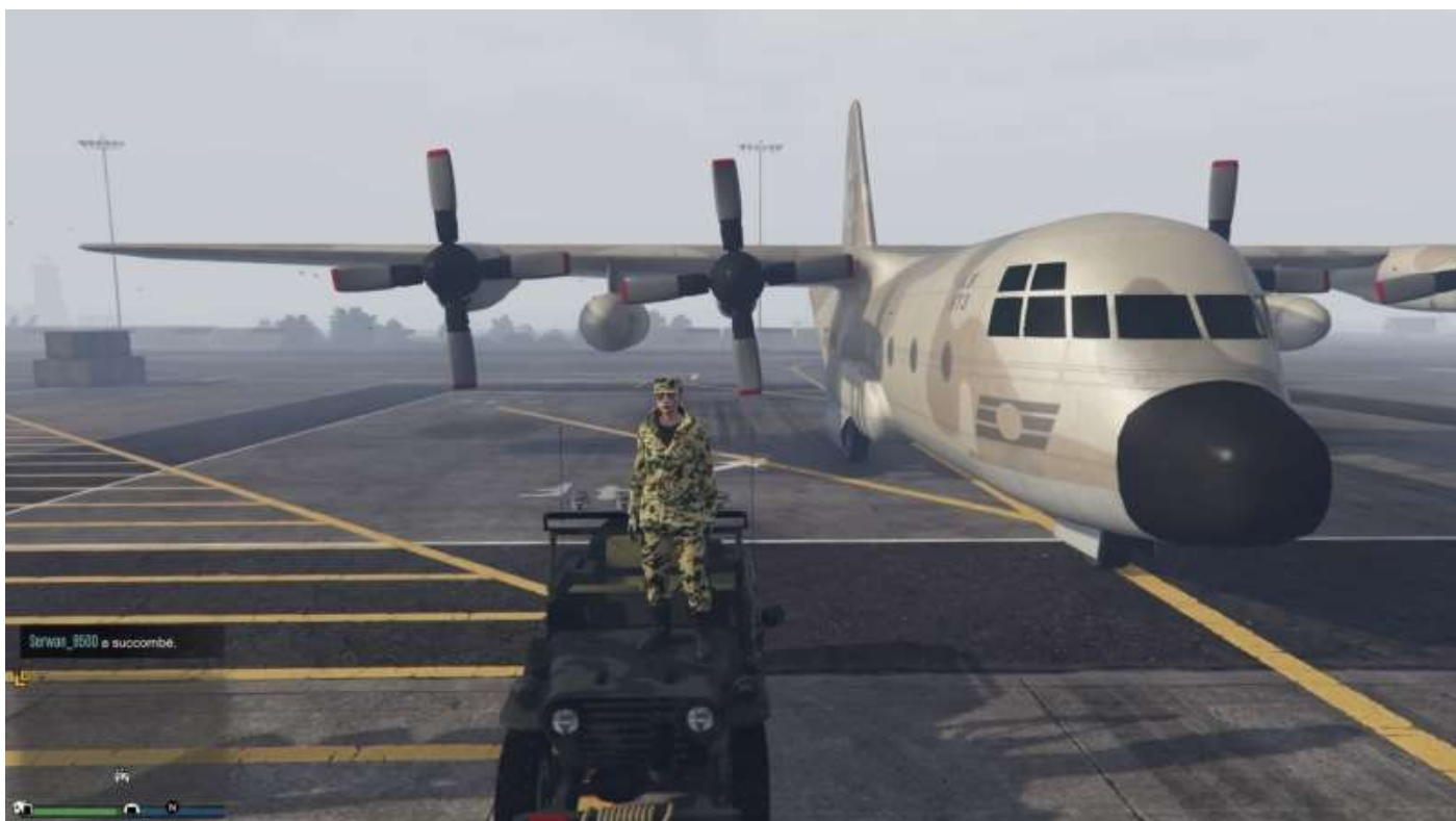
Un Titan en stationnement à la Base 0101 de Fort Zancudo (à droite ; à gauche, c'est la Jipe du lieute).