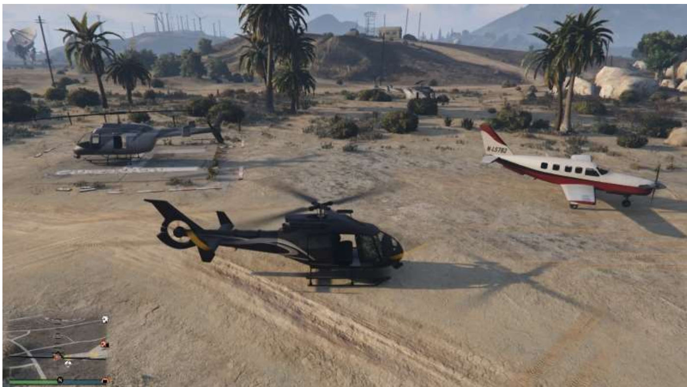
Deux Frogger et un Velum (à droite sur le cliché, reconnaissable à sa voilure non tournante)