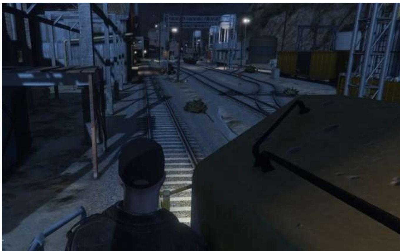
L'arrivée du train en gare de La Cité de Paleta Bay , arrêt pour la nuit. On continue demain.