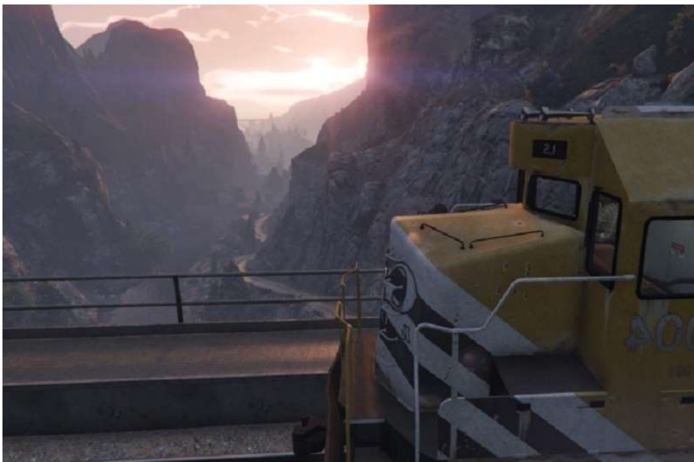
Coucher de soleil dans les canyons