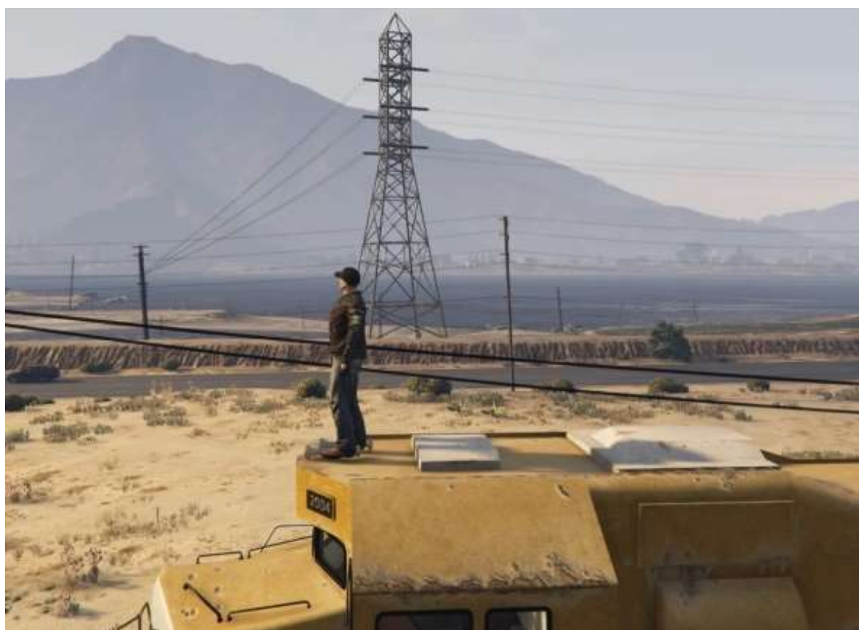
Très fort ! Le lac Alamo ...