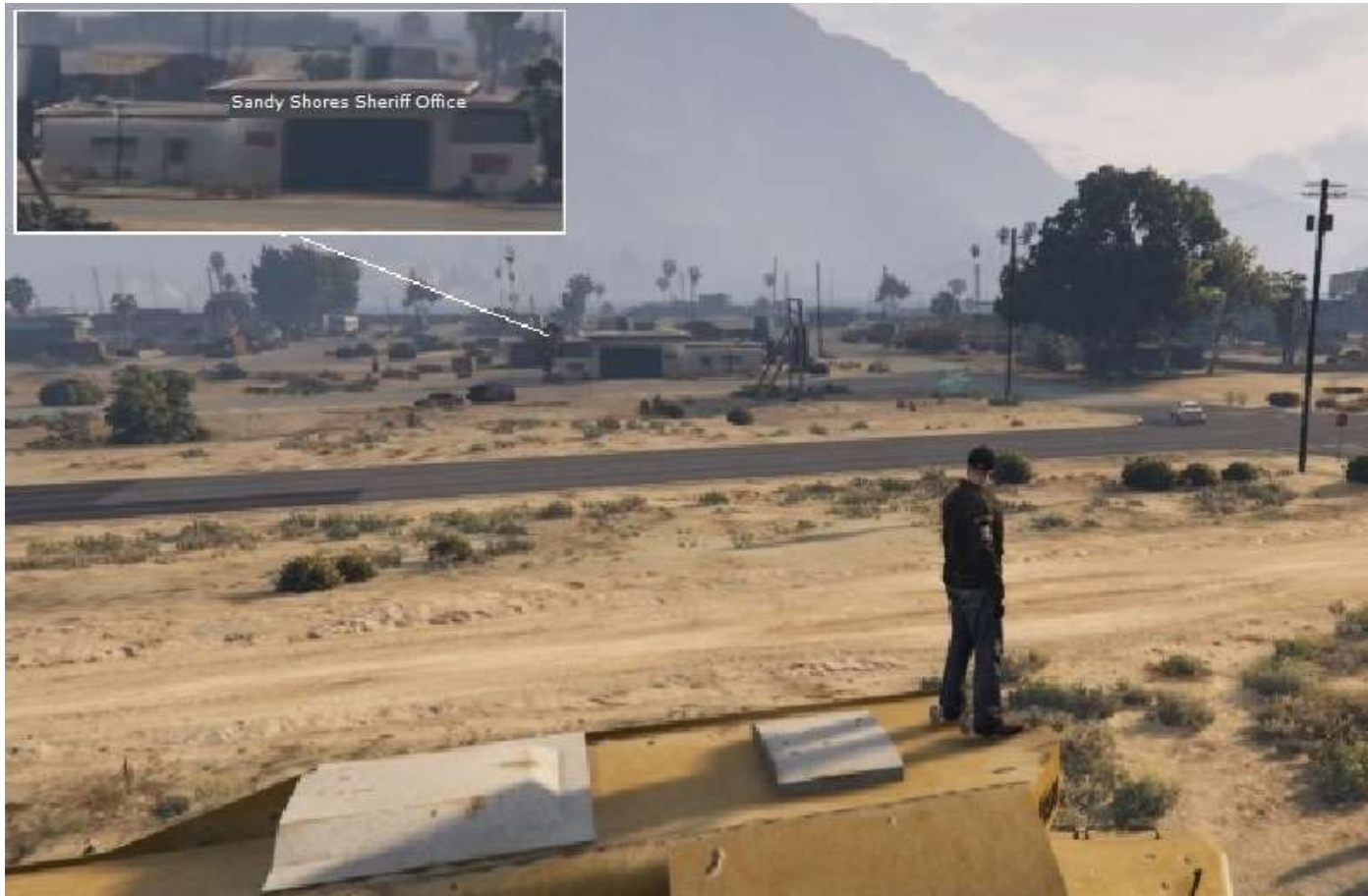
Lendemain, départ de Paleta Bay , on passe devant les bureaux du Sheriff du Blaine County ...