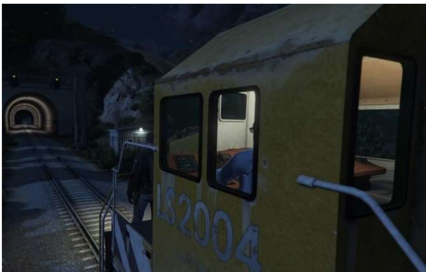
Entrée dans un tunnel