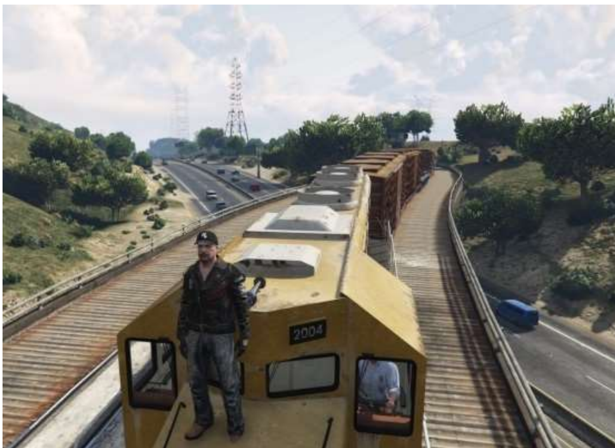
Hôpital, Urgo sur le front et départ de Los Santos . L'autoroute Leonard de Vinci.