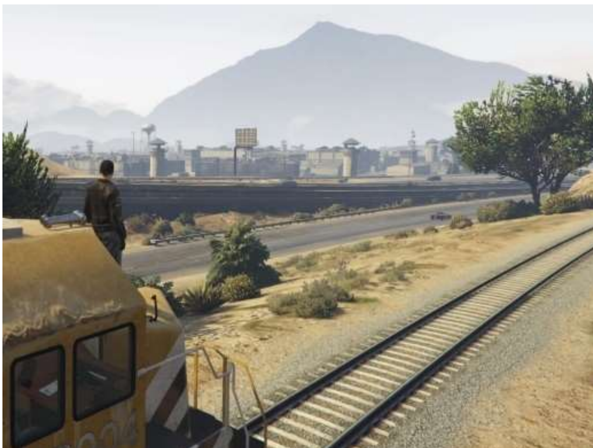
Les por-tedu-pénitencier de Bolingbroke