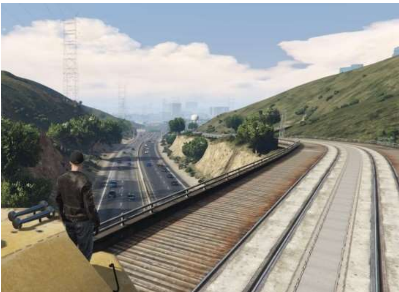
Arrivée à Los Santos