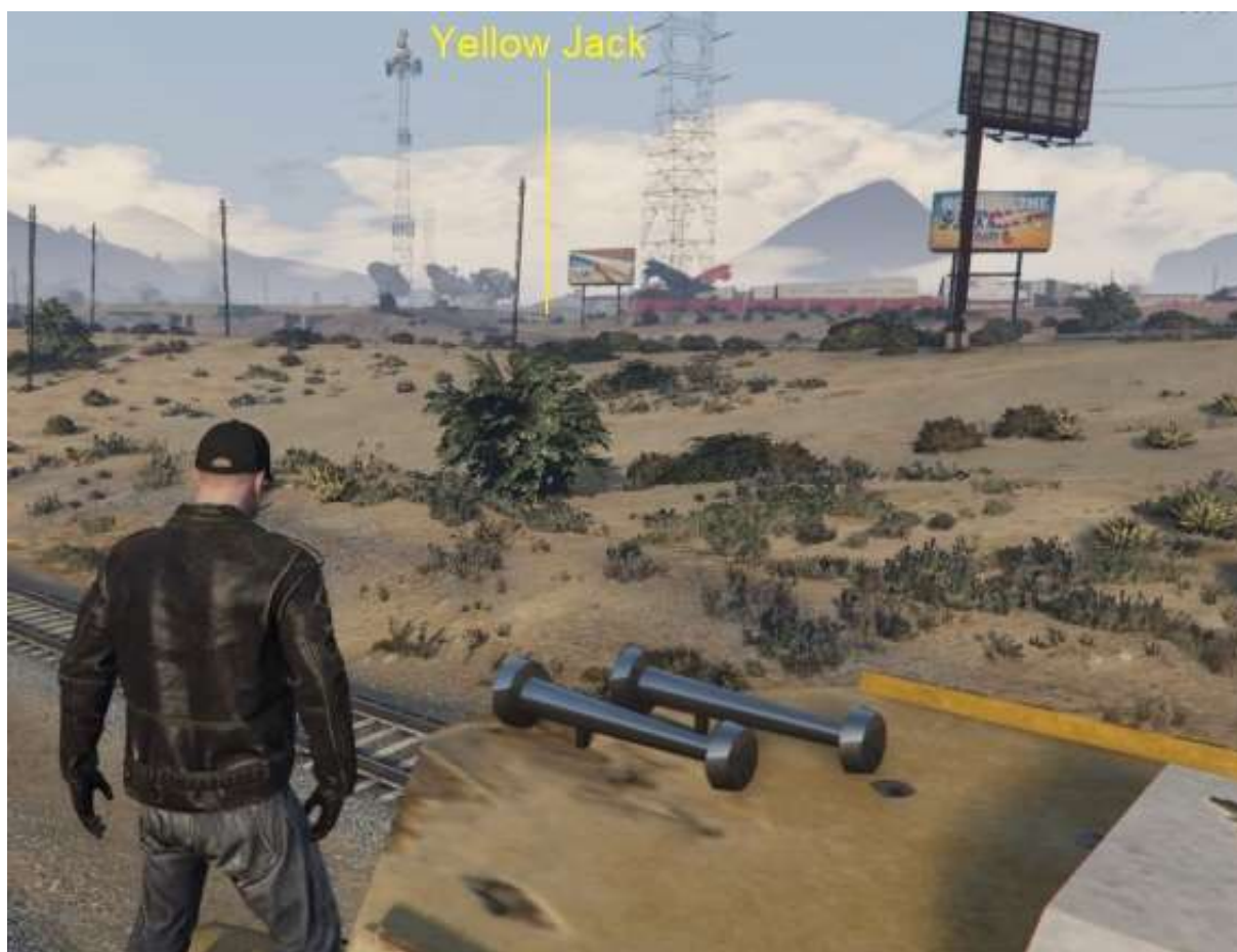
Au loin, le bar Yellow Jack .