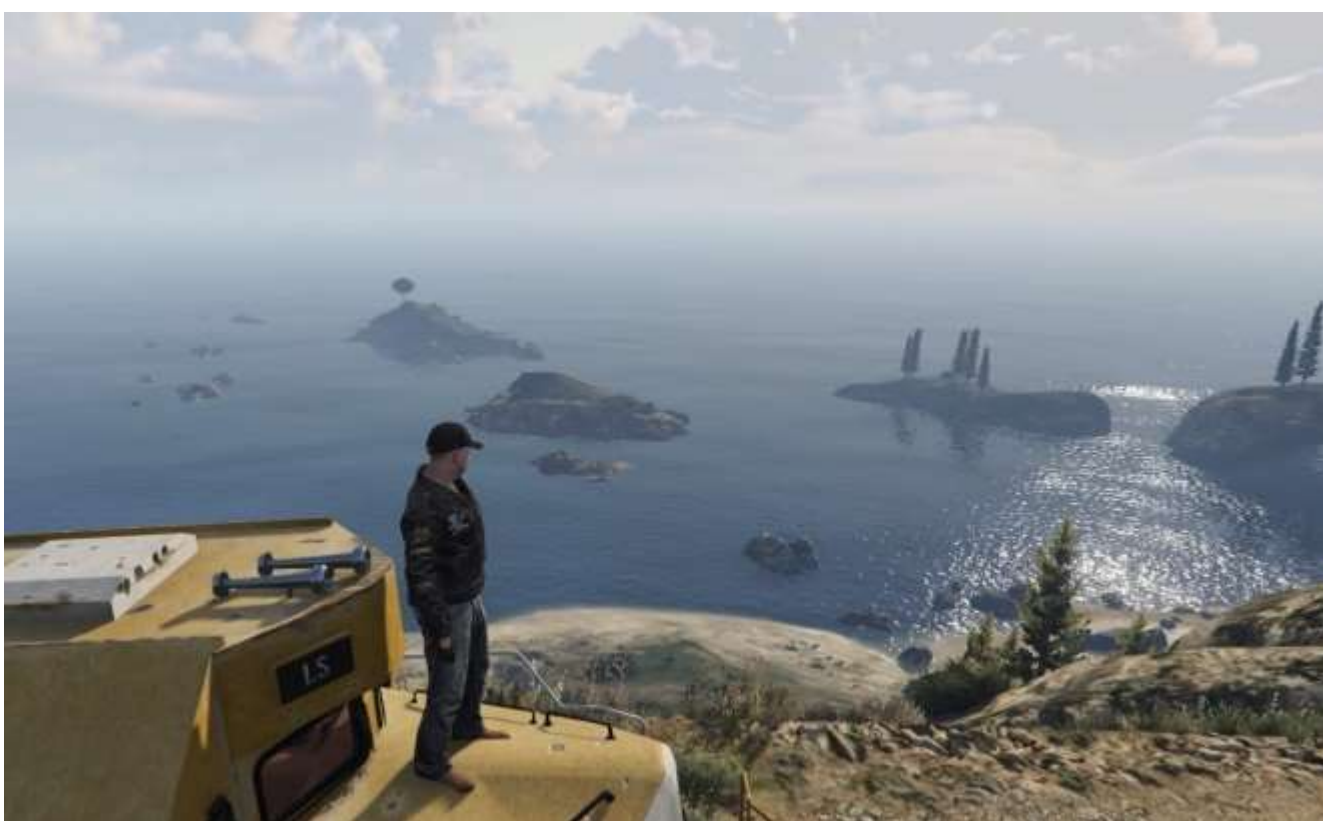
Vue sur l'océan

La Rédaction-en-Chef remercie le général Talzin, et poursuivons notre reportage 4 .