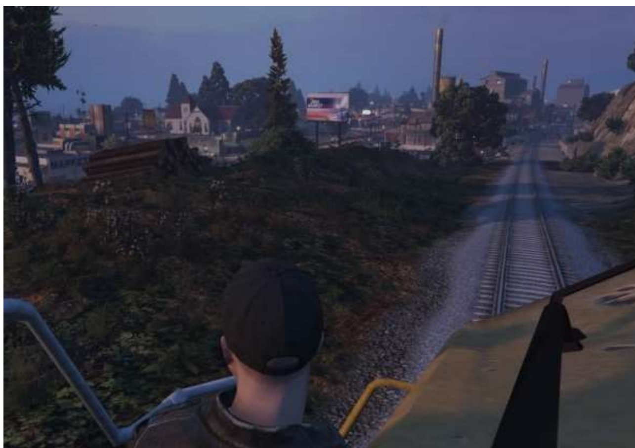
Arrivée à Paleta Bay