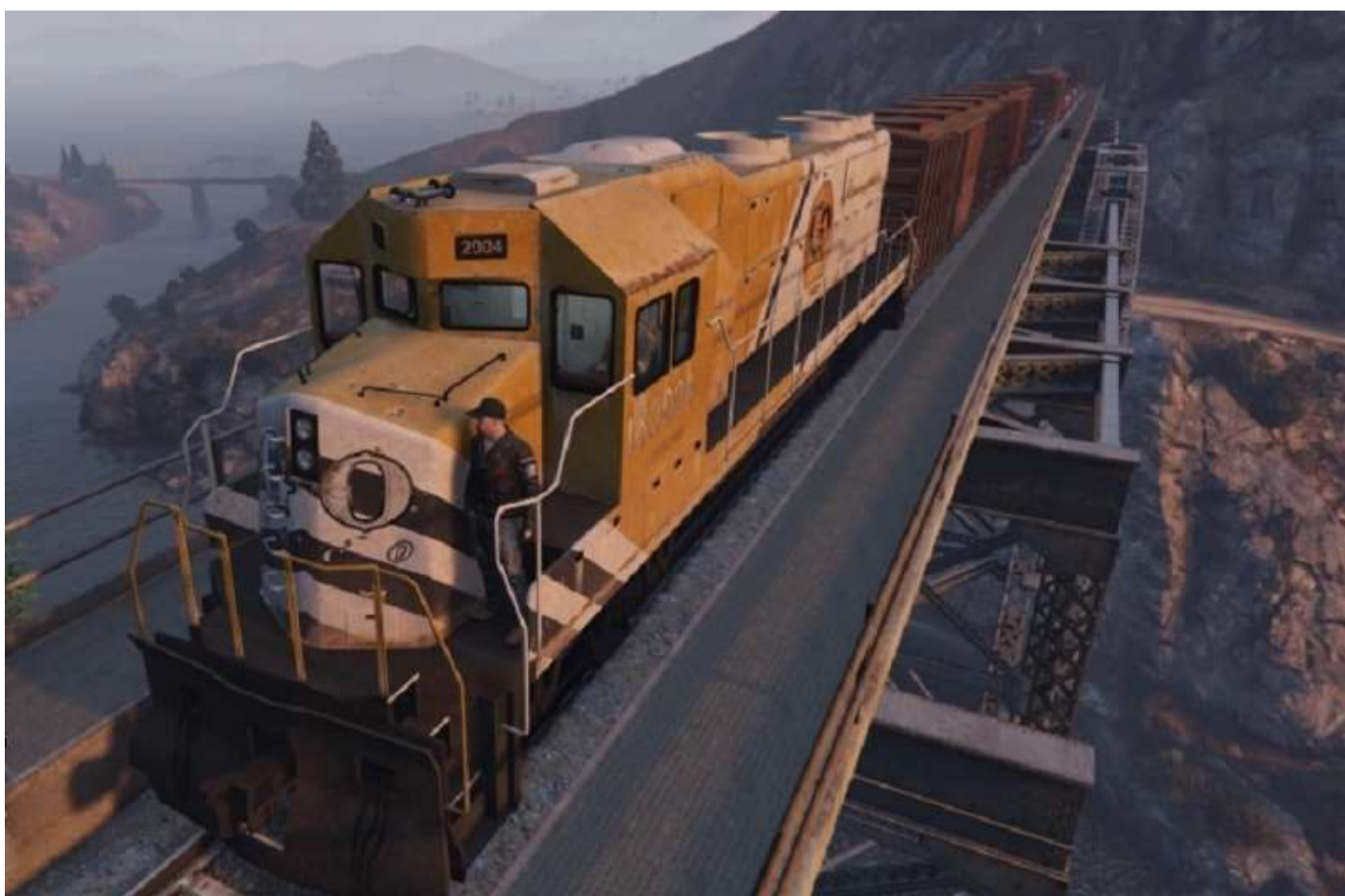
En bas, la Cassidy Creek .