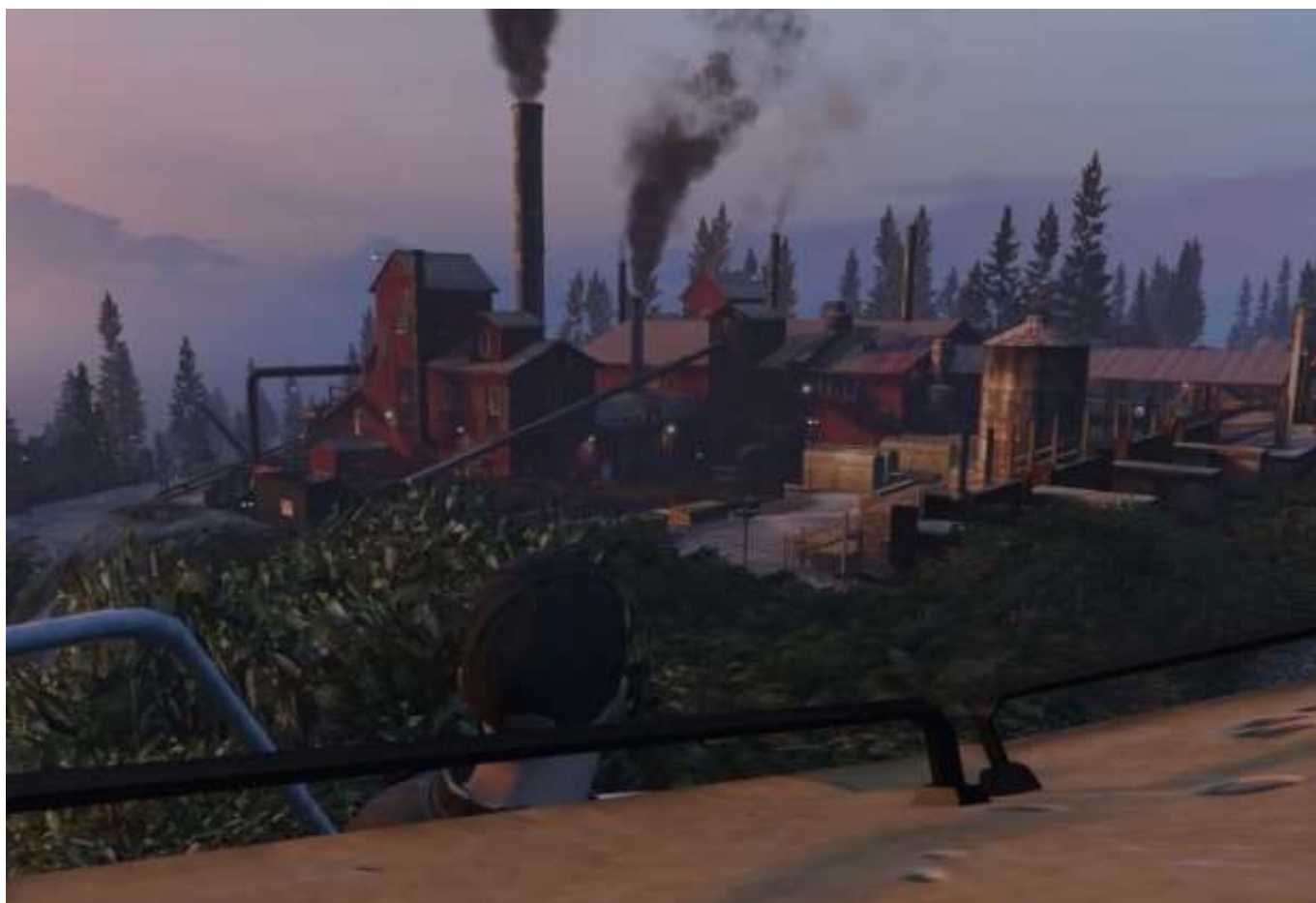
Coucher de soleil sur la scierie de Paletto Bay