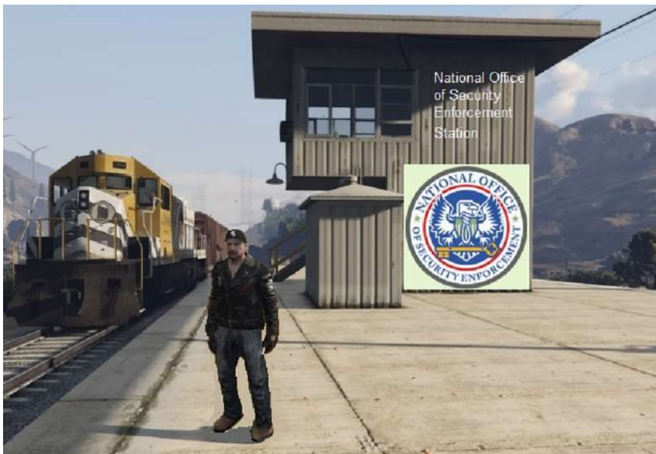
... et retour à la halte NOOSE. La boucle est bouclée.