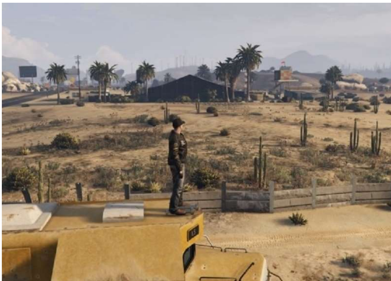
... puis devant l'aéroclub de Sandy Shores ...